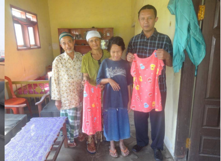
Kleding voor Idul Fitri