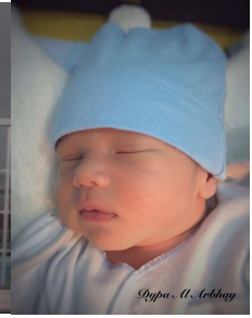
zoontje van Puspa