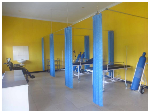
1 e hulp

Semangat heeft voor de fondsen die ondersteund hebben een eindverantwoording opgesteld.