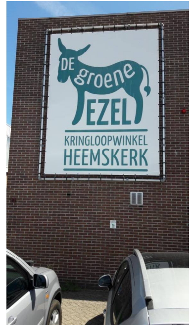
de Groene Ezel