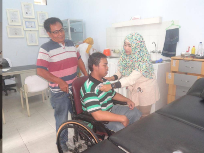
Check door de huisarts