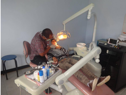
Op controle bij de tandarts

Voor Idul Fitri (Suikerfeest) dat eind juni werd gevierd hebben de kinderen nieuwe kleding ontvangen.