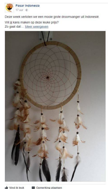
Like en share Facebook

In samenwerking met de School in Maasbree is er een project over Indonesië gestart waar ook onze Pasar deel van uitmaakt. Daar hebben we deelgenomen aan de opening van de Wereld Express Bus en zijn we geïnterviewd door de lokale omroep P&M. Het filmpje kunt u bekijken op de website van de omroep: http://www.omroepenm.nl/express-bus-in-maasbree/tvgemist/item?W6MQyVNWY6Gx7F2IQxnsWQ=%3D .