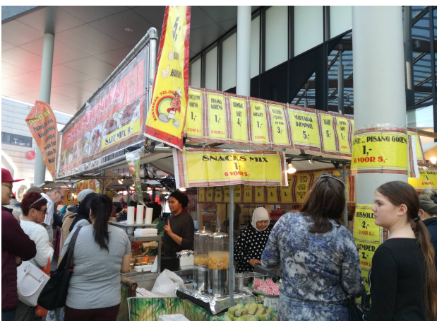
Heerlijk Indonesisch eten