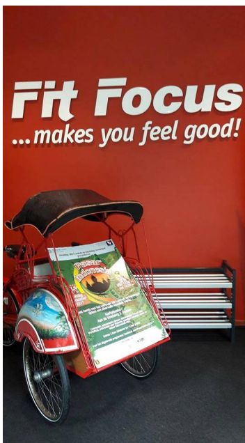
Becak met poster

Verder hebben we spandoeken geplaatst, staan er beca's met reclameborden en natuurlijk hebben we ook posters om dit evenement aan te kondigen.