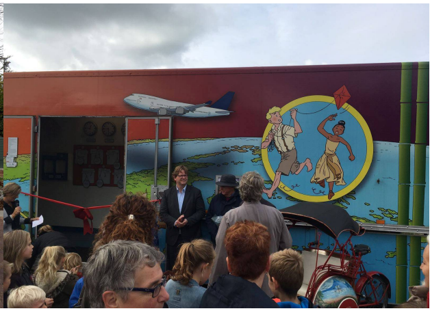
Promotie tijdens de opening van de Wereld Express Bus bij de School in Maasbree

Het programma van deze Pasar bestaat uit optredens van diverse artiesten en een pentjak-demonstratie. Dit alles in de sfeer van een gezellige mondiale markt met een diversiteit aan kramen. Natuurlijk is er ook Indonesisch eten en kunnen de kleintjes zich laten schminken. Op de laatste pagina van deze nieuwsbrief vindt u de poster met het volledige programma.