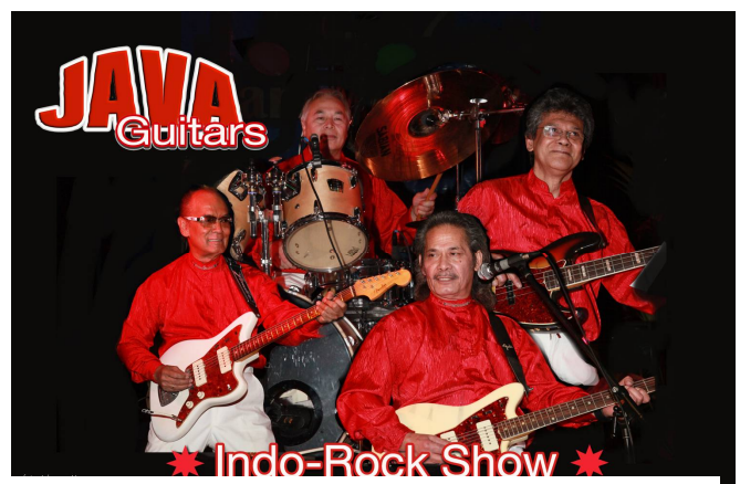
De Java Guitars