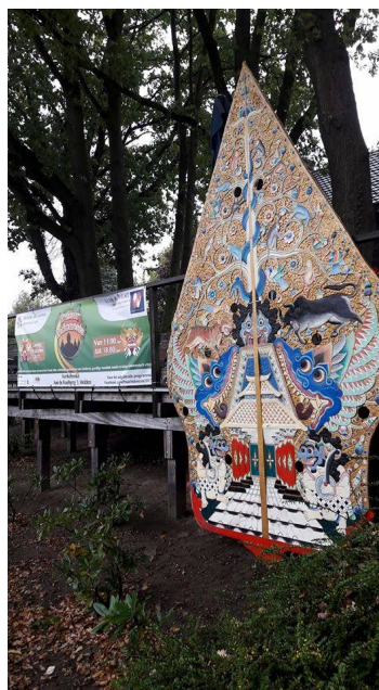
Promotie bij Kerkeboske