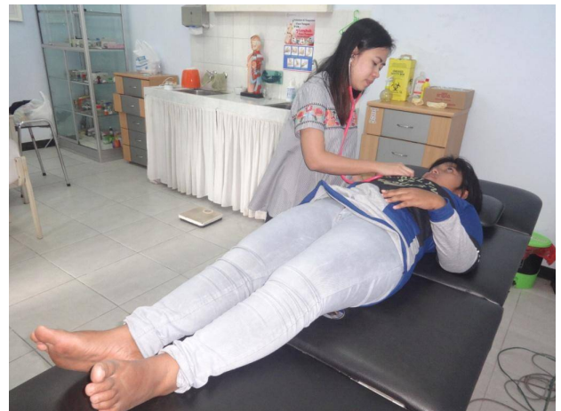
Medische check up