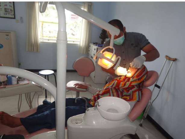
Controle door tandarts

Voor het Suikerfeest in juni heeft een aantal van hen nieuwe kleding ontvangen.