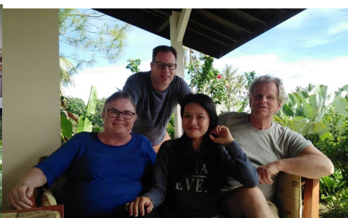
Iis bij ons op bezoek