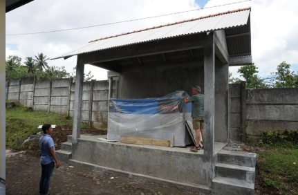
De generator wordt aangesloten