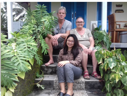
Met Ayu op de foto