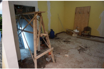
De verbouwing start