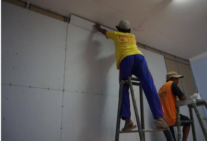
De verbouwing is in volle gang