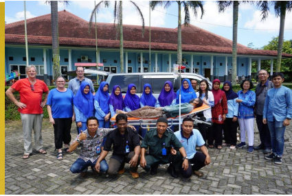
Een deel van het personeel