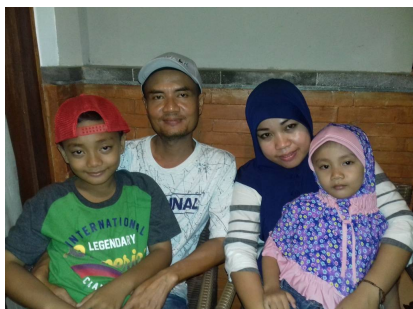
Koming met haar gezin

Ook onze 2 ouderen zijn allebei gelukkig nog in goede gezondheid.