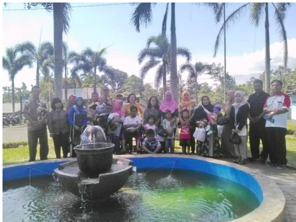
bijeenkomst van de gehandicapten