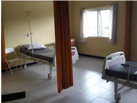
een van de nieuwe kamers