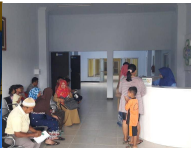
de vernieuwde receptie