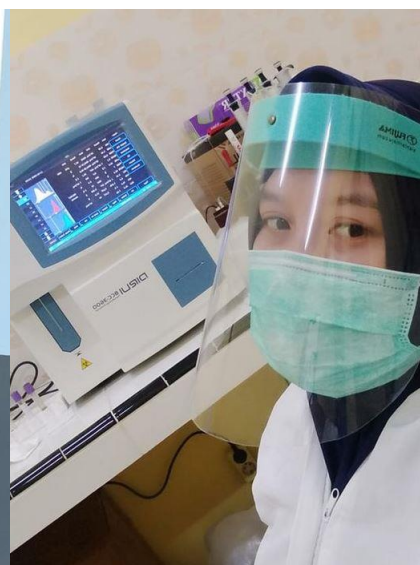
Aan het werk in het laboratorium