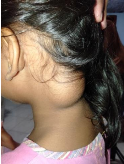
Chelsia voor en na de operatie