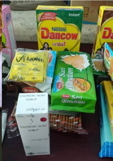
Vitamines en gezonde voeding