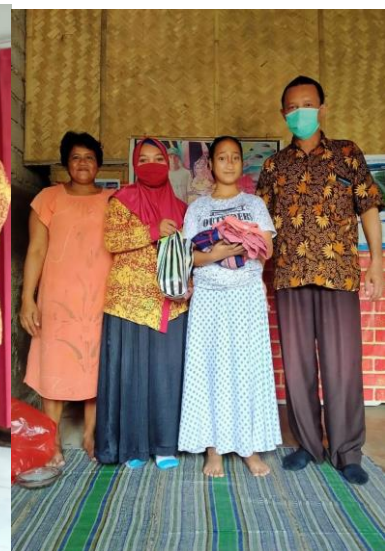
Nieuwe kleding voor Idul Fitri