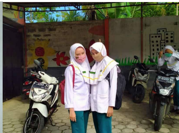
Yuli (rechts) op school