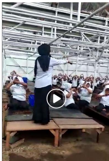
Voorlichting over corona

Van ziekenhuis VieCuri in Venlo heeft onze zusterorganisatie Semangat 2 anesthesie-apparaten ontvangen Dit ziekenhuis is gestart met het vernieuwen van de operatiekamers. Hierdoor is een gedeelte van de apparatuur overbodig en zijn deze 2 apparaten aan ons geschonken. Te zijner tijd worden de apparaten getransporteerd naar Indonesië voor gebruik in de kliniek in Garahan.