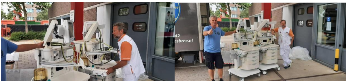
De anesthesie-apparaten die Semangat van VieCuri heeft ontvangen